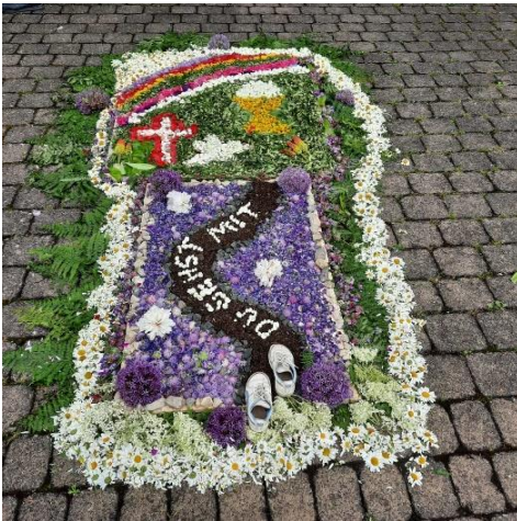
Blument Teppich der Kommunionkinder